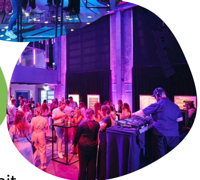
Umbau in Party mit Stehtischen und DJ