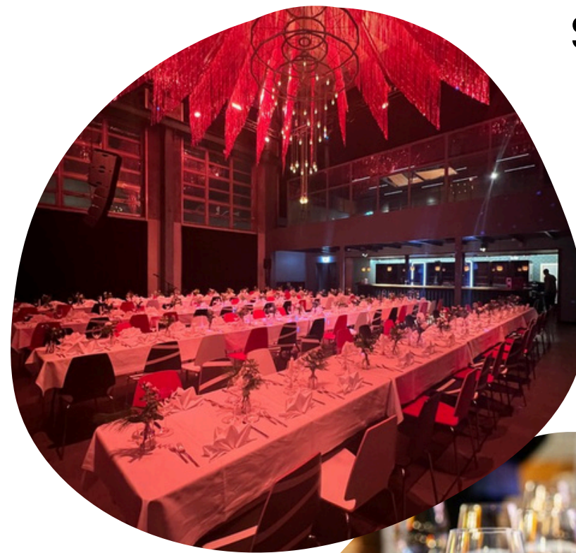
Seated Dinner im Event Space