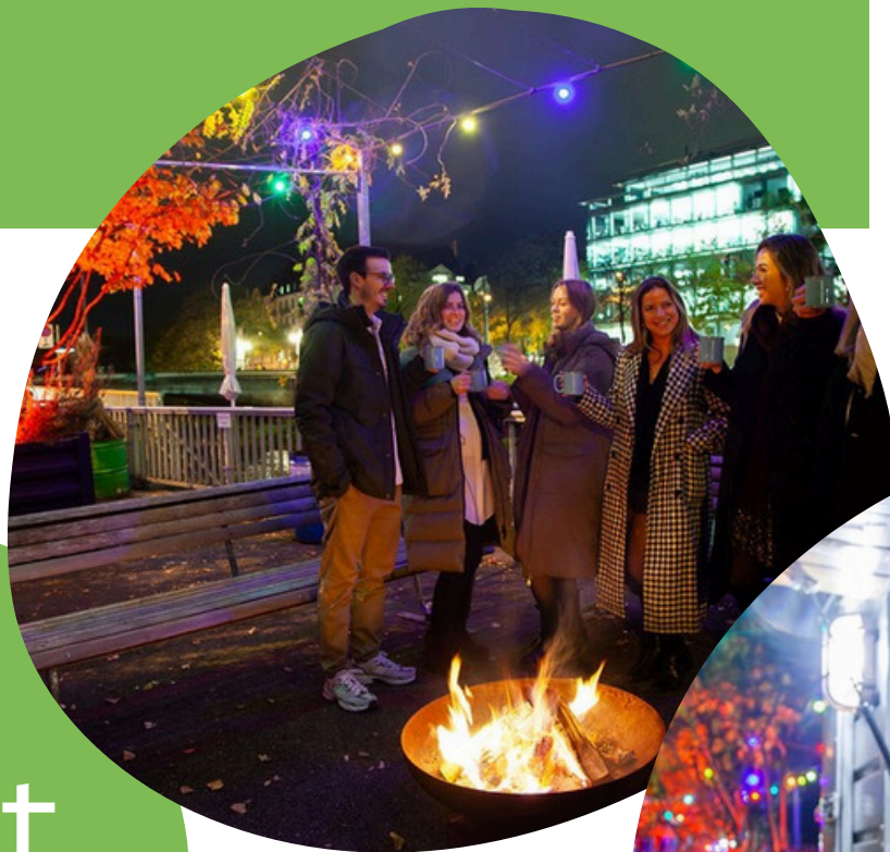
Apero mit Glühwein und Marroni auf der Terrasse